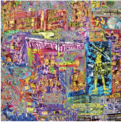
「Graffiti Paris Signboard」