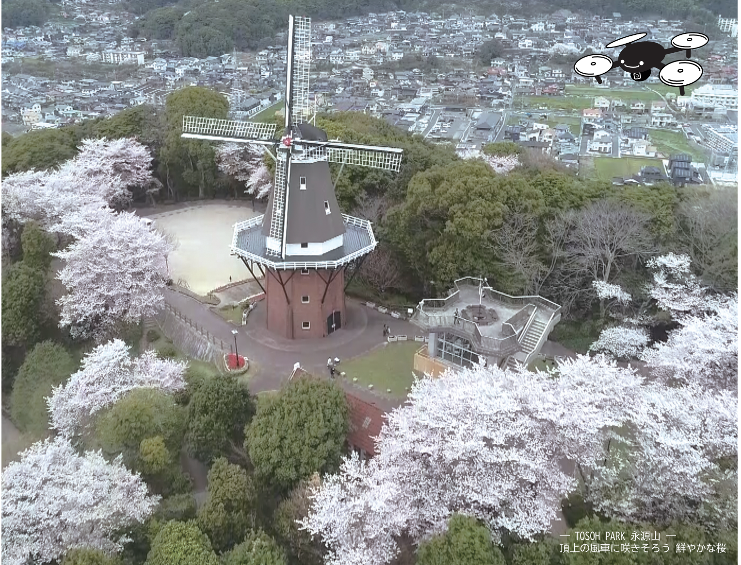
— TOSOH PARK 永源山 — 頂上の風車に咲きそろう 鮮やかな桜